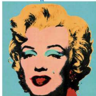
Andy Warhol, Marilyn Bleu, 1967

→ Que voyez-vous ? Qu'a voulu faire l'artiste ? Comment a-t-il fait ? Quels procédés