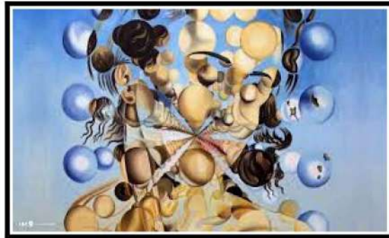
Galatea des espheres, Dalí, 1952