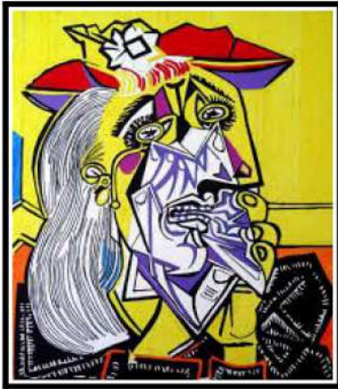
La femme qui pleure, Picasso, 1937

→ Que voyez-vous ? Que ressentez-vous ? Quelle expression a-t-il ? Comment est composé ce visage ? Quelles formes géométriques ? Quels outils ?