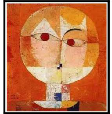
Paul Klee, Senecio, 1922

→ Y'a-t-il des points communs à ces 3 oeuvres ? Pourquoi les artistes ont-ils choisi des formes géométriques ? Quel sentiment se dégage de chacun de ses portraits ?